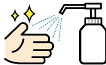
受付に消毒液の設置